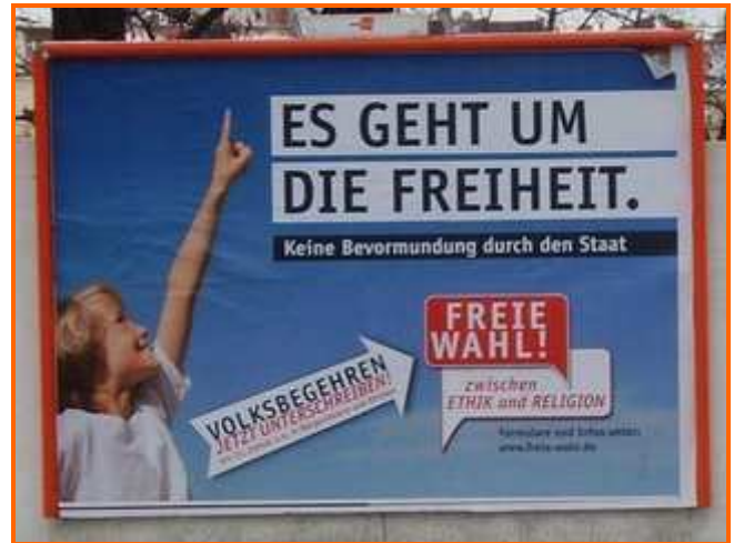
Am 26. April 2009 ist der Volksentscheid!

Nachdem sich der neue Ortsvorstand am 26. Januar 2009 konstituiert und zusammen mit vielen Mitgliedern am 15. Februar 2009 eine Klausurtagung erfolgreich durchgeführt hat, wollen wir nun durchstarten. Die bislang feststehenden Termine entnehmen Sie bitte